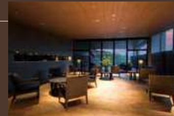
湯上がりラウンジ