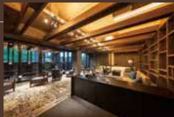
VIALA会員専用ラウンジ