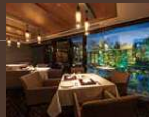
maison de forêt(フレンチ)

浅間山を眺めながら朝食を愉しむブッフェ「asama dining」、落ち着きと開放感を合わせ持つフレンチ「maison de forêt」、そして、庭園の四季を愛でる日本料理「新樹」。個性あふれる3つのダイニングがリゾート時間を演出します。