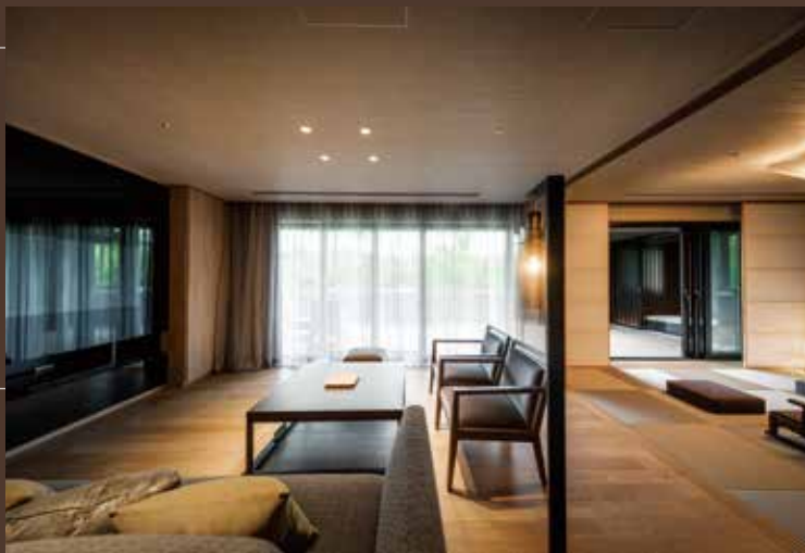
シグネチャー和洋室

ゆったりとお寛ぎいただけるよう全室バイブラバス付き。開放感広がるガーデンルーム「コンサバトリー」付きのタイプや、100㎡を超えるスイートタイプまで、様々な部屋タイプをご用意しています。(ルームチャージ制)