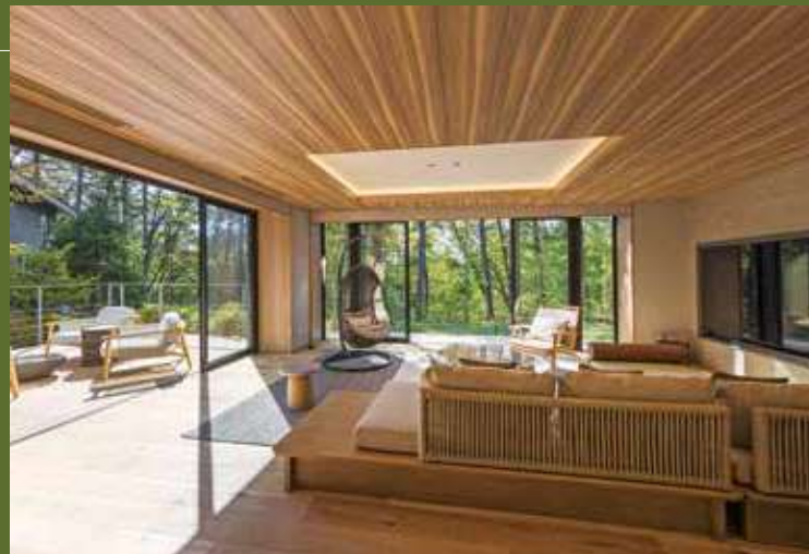
creek/シグネチャースイート

戸建てスタイルで、独立感と開放感を満喫。吹き 抜けのリビング・ダイニングに和室を設けた2階 建ファミリースイート、130㎡を超えるシグネチャー スイートなど、個性あふれる客室をご用意してお ります。