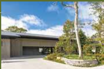
エントランス・アプローチ

豊かな自然と寛ぎを追求した空間で皆様をお迎え いたします。ロビーには、ゆとりのあるVIALA会員優 先ラウンジもご用意。 隠れ家ならではの上質をご体感いただけます。