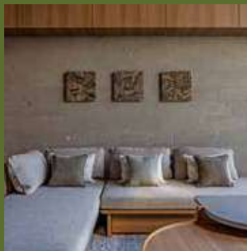
creek/シグネチャースイート