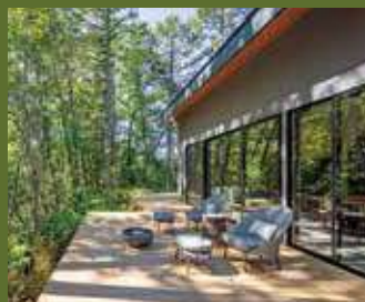
garden/シグネチャースイート