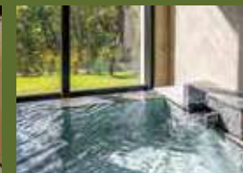
creekとgardenの全客室に半露天の温泉風呂とキッチンを設置