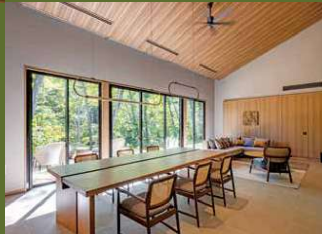
garden/シグネチャースイート