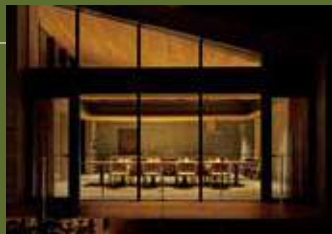
プライベートダイニング