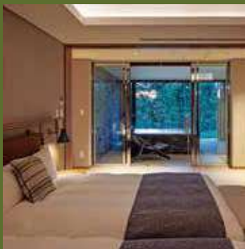
creek/シグネチャースイート