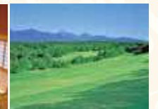
那須国際カントリークラブ