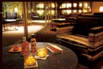
VIALA会員専用ラウンジ