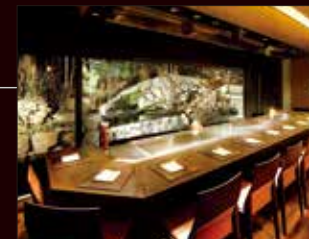
鉄板焼カウンター