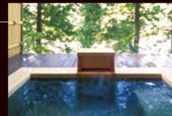
客室露天風呂 (VIALAデラックス・VIALAスイート) ※お部屋によって仕様が異なります。