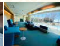
レイクサイドラウンジ