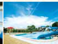
屋外プール(夏期営業のみ)