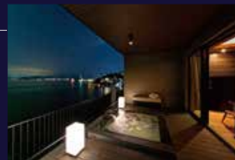
客室温泉露天風呂