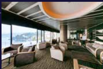
VIALA会員優先ラウンジ

クスノキに温かく迎えらるるエントランスを抜けると、落ち着きに満ちたロビーに、眺望テラスではゲストを包み込むように迎えてくれる海の眺めが広がります。