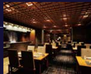
日本料理「菫(き)らく」

緑越しに海を望む日本料理「菫らく」、食と眺めを手軽に楽しむbuffet「Oli-va(オリヴァ)」、東館最上階にあるフレンチ「Côte & Ciel(コート・エ・シエル)」と、気分に合わせて食事のスタイルを選べます。