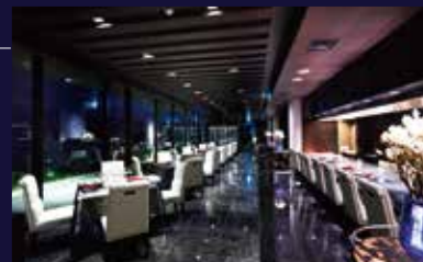
フレンチ「Côte & Ciel (コート・エ・シエル)」