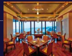
ブッフェ「Oli-va (オリヴァ)」