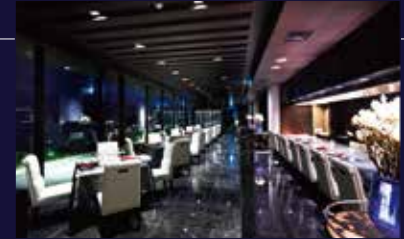
フレンチ「Côte & Ciel(コート・エ・シエル)」