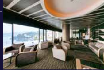
VIALA会員優先ラウンジ

クスノキに温かく迎えらるるエントランスを抜けると、落ち着きに満ちたロビーに、眺望テラスではゲストを包み込むように迎えてくれる海の眺めが広がります。