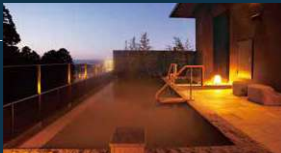
温泉露天風呂「金湯」

露天風呂に「金湯」、内風呂・家族風呂に「銀湯」を引いた大浴場。ジャグジーを備えた屋内温水プールやボディケアスタジオ、エステサロンで質の高いホスピタリティを目指します。