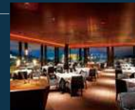
イタリアン「リストランテ アルトゥーラ」