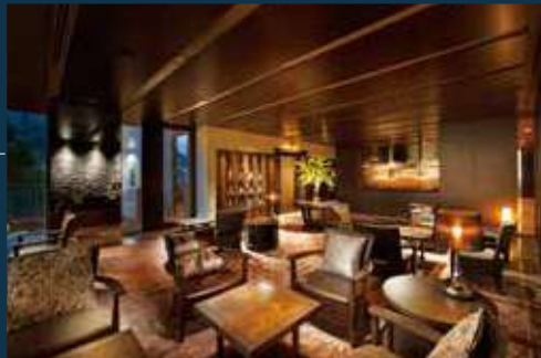
VIALA会員優先ラウンジ

開放的なロビーからVIALAへのエントランスを抜けると、上質でゆとりある特別な時間が始まります。VIALA会員優先ラウンジでは、プライベートな落ち着いた空間でのティータイムや読書など贅沢な大人の寛ぎのひと時をお過ごしいただけます。