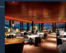
イタリアン「リストランテ アルトゥーラ」