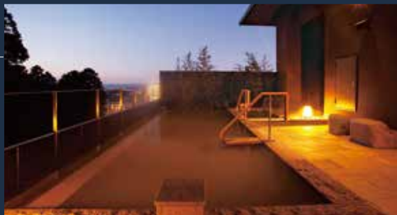
温泉露天風呂「金湯」

露天風呂に「金湯」、内風呂・家族風呂に「銀湯」を引いた大浴場。ジャグジーを備えた屋内温水プールやボディケアスタジオ、エステサロンで質の高いホスピタリティを目指します。