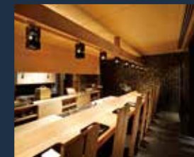
日本料理「澪里」(割烹カウンター)