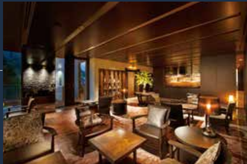
VIALA会員優先ラウンジ

開放的なロビーからVIALAへのエントランスを抜けると、上質でゆとりある特別な時間が始まります。VIALA会員優先ラウンジでは、プライベートな落ち着いた空間でのティータイムや読書など贅沢な大人の寛ぎのひと時をお過ごしいただけます。