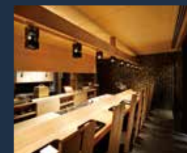
日本料理「澁里」(割烹カウンター)