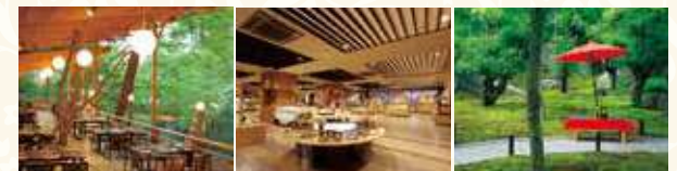
京料理 溪流床(夏季限定) 染織工芸館

客室数:83室 ※総客室数133室(VIALA annex京都鷹峯37室、東急不動産所有分13室含む) / ラウンジ / レストラン / 露天風呂付温泉大浴場 / スパ / 染織工芸館 しょうざんリゾート京都:レストラン(4ヶ所)